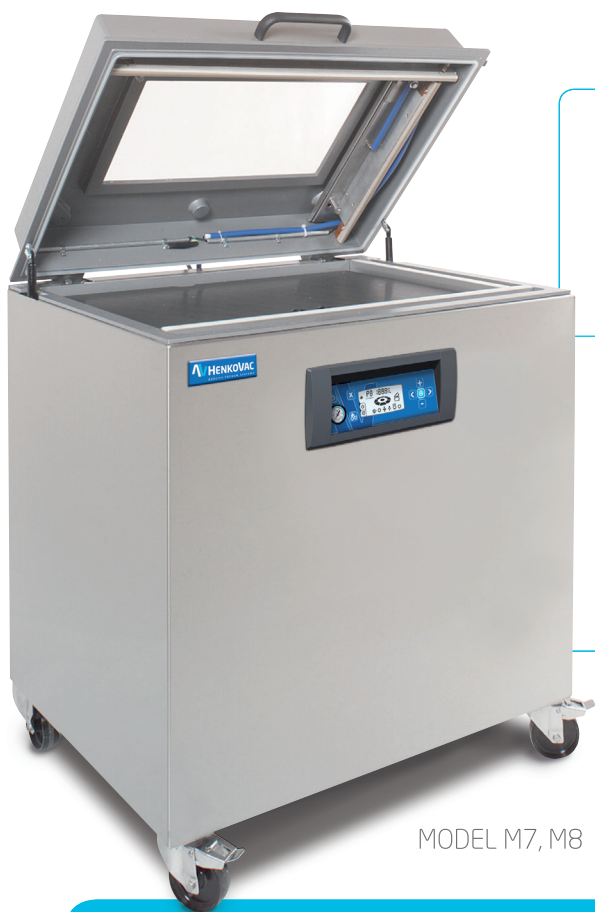
MODEL M7, M8